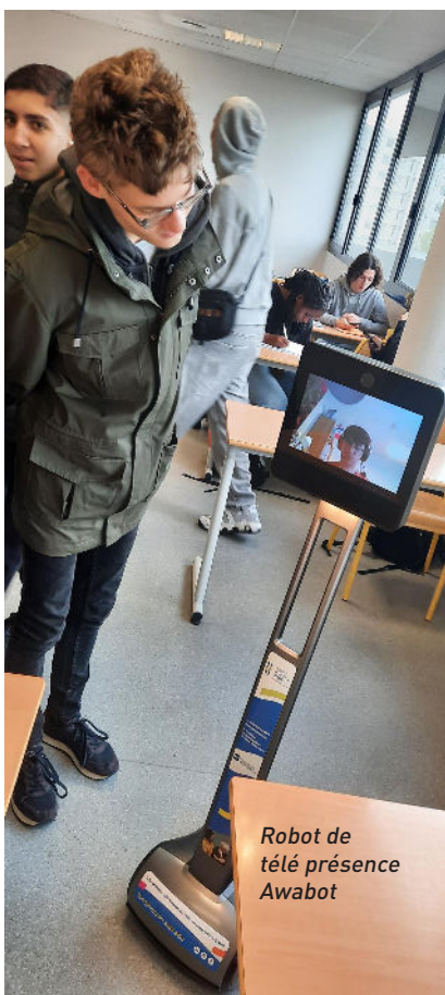
Robot de télé présence Awabot